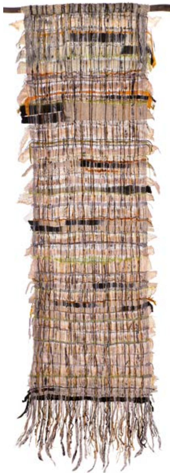
Sans Titre ▲ Tissage (laine et fibres synthétiques) 265 x 98 cm 2023 Sophie Barbier et Élisabeth Merle - Vanves Image Photo et Les Ateliers Expression