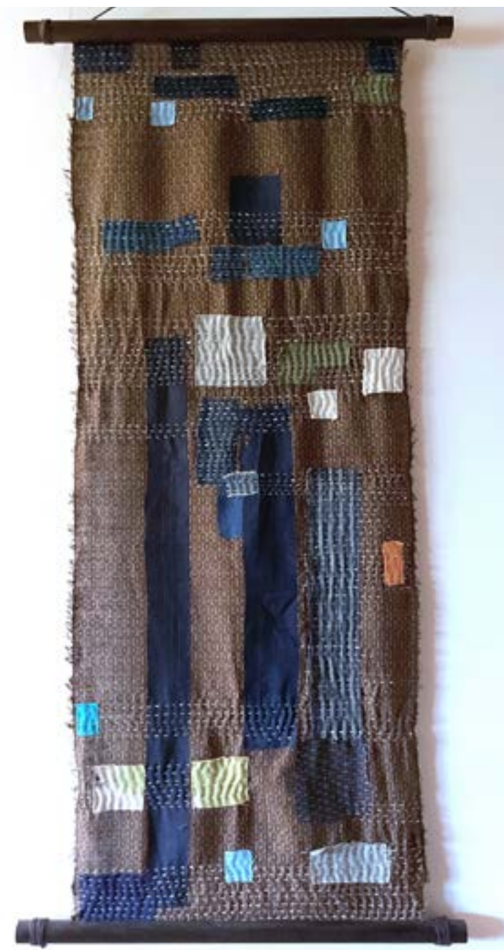
▲ Of night, light and half light Textile, timber rods, string 90x30 cm 2021