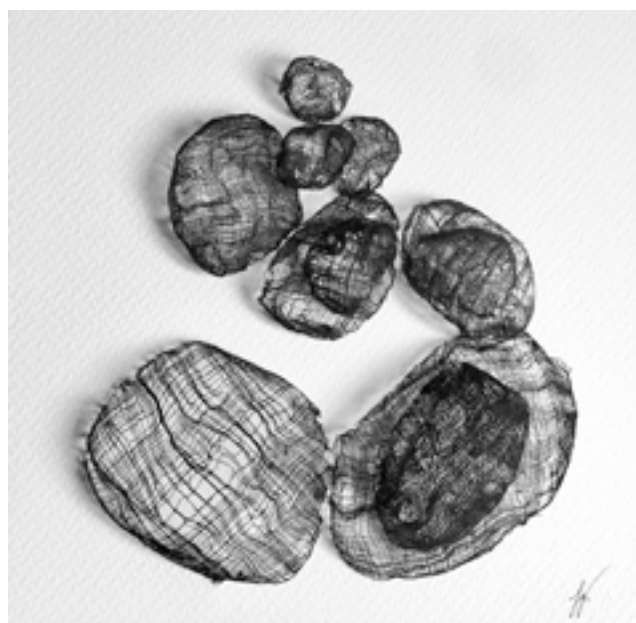
Empiler 3 ▲ Tissu de coton encré et moulé puis cousu sur papier aquarelle 30x30 cm 2022