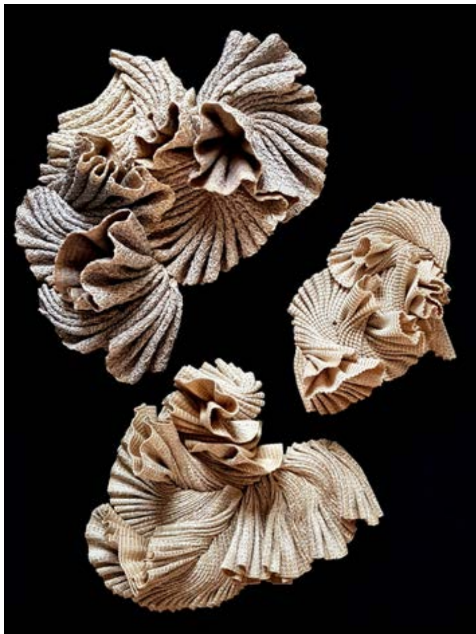
Champignons ▲ Écriture de plis cousus 104x72 cm 2024