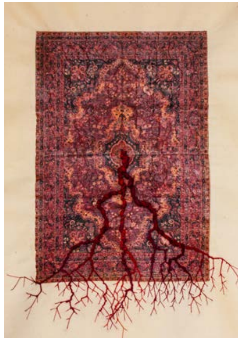
▲ Roots in Rugs: Threads of Eternity Techniques mixtes sur toile 70x60 cm 2023