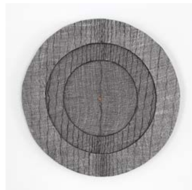
▲ Sans titre Mixed media 31 Ø 2024