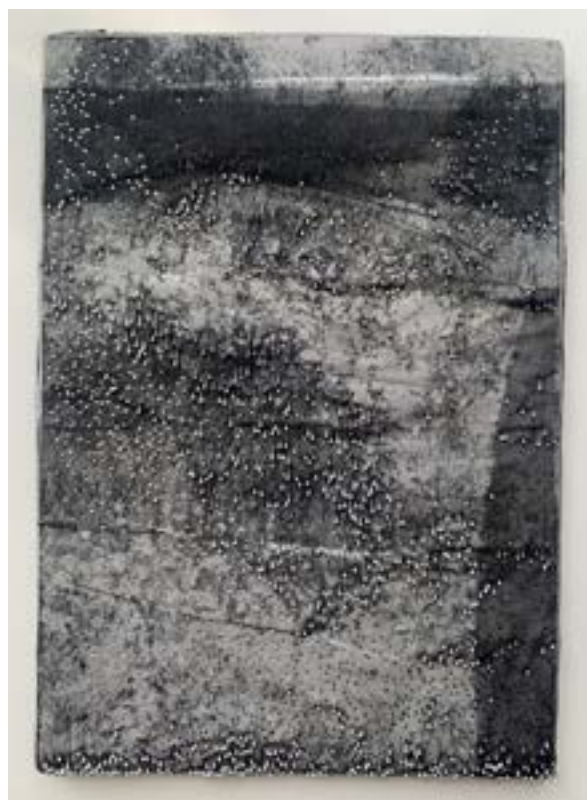
Dans la chaleur vacante. Séries des "Pluies d'été" ▲ Art textile 30x21 cm 2023