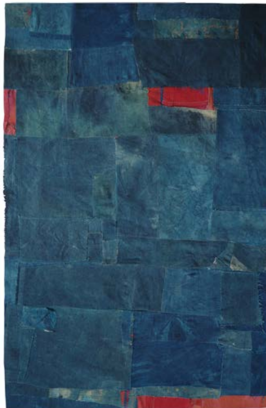
▲ Tissu comme peinture Indigo cousu 98x64 cm 2024